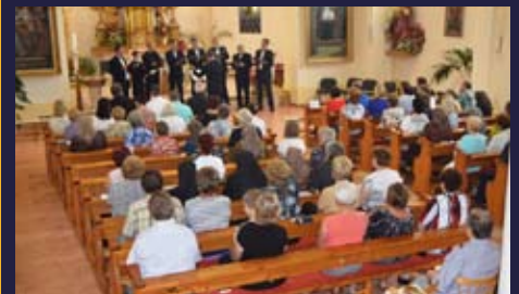
Koncert Zboru Sväto - pokrovskeho chrámu z Užhorodu vo Farskom kostole sv. Michala, archanjela v mestskej časti Košice - Poľov - 4. júla 2016