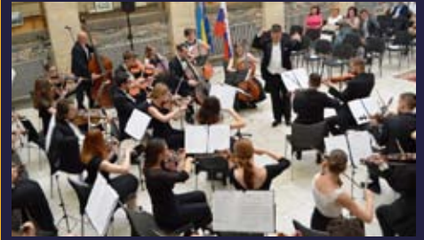
Musica Iuvenalis na slávnostnom koncerte pri príležitosti začiatku predsedníctva Slovenska v Rade Európy v Užhorode - 29. júna 2016