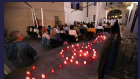
Neopakovateľná atmosféra Sviečkoveho koncertu na nádvorí Barkóczyho paláca v Košiciach, ktorú umocňovali chorály Scholy Cantorum Budapestiensis - 6. júla 2016