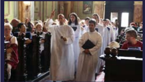
Mužský zbor St. Ephraim z maďarskej Budapešti na Otváracom koncerte festivalu - 5. júla 2016